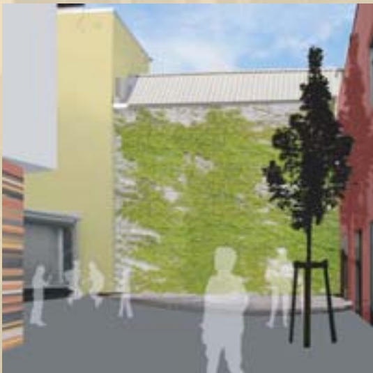
Fassadengestaltung durch Farbe Begrünung der Brandwand Erzeugen von Aufenthaltsbereichen