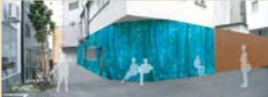
Künstlerische Fassadengestaltung, Betonung der Architektur