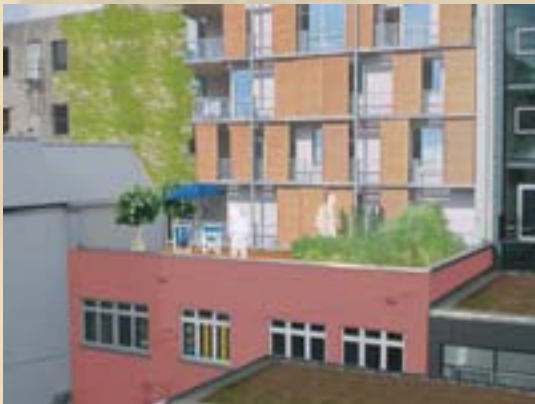
Umnutzung der Obergeschosse, Nutzen der Flachdächer mit Südsonne: Neues Wohnen in der Stadt