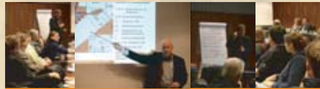
Die Diskussionen aus dem Workshop

Der Workshop zum Waldhof wurde von Eigentümern, Gewerbetreibenden und Anwohnern gut besucht und es wurden in einer konstruktiven Atmosphäre Visionen für den Hof entwickelt.