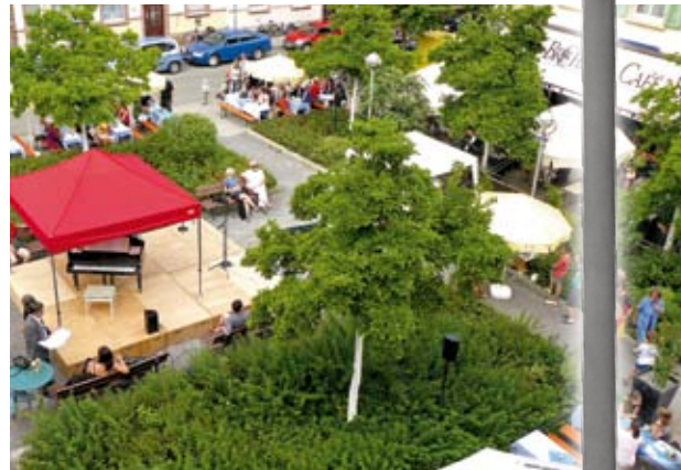
Der Brahmsplatz als Open-Air Bühne